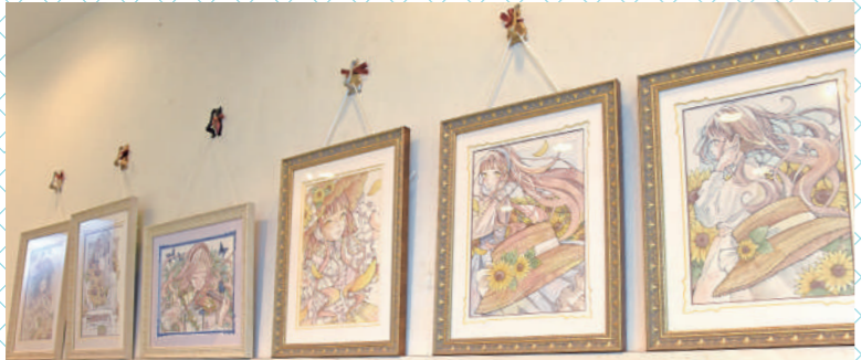
▲店内の壁にはとあるお茶さんの絵がたくさん！

し …ネットショップ販売で缶を使っていただけでも多いですね。そんな中、オリジナル缶を作っていた良かったですよね！ さ …他店の発信を見ていて、オリジナル缶いいなと思って作ったんです。でも実際どんな缶を作っていたか分かんなくて…例えばお店のロゴにひまわりの花をあしらっただけだと面白くないな…って。笑 ある日、X(旧Twitter)を見ていたら大人気イラストレーターとあるお茶さんの絵を見かけて「この方が絵を描いてくれたらオリジナル缶作ってみようかな」と思いメッセージを送ったらご承諾いただけました。笑 …言ってみるもんだなあ。笑 し …缶はパッケージですけど、お菓子と一緒にいろんなところに届きますよね。お店のファンの方が買われて広がったりとかとあるお茶さんのファンが缶がきっかけでお店を知るとか。作家さんと仕事をすると新しい出会いが生まれますよね。 さ …オリジナル缶のサイズで参考にしたのはネコとリス缶です。クッキーの量をいっぱい入れたかったので、ネコとリス缶よりも缶の胴を1センチ高くしてます。高さの分クッキーが枚数多く入ったところで原価的にはそ