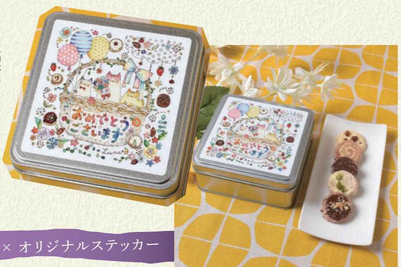
郷土菓子処 香月 / 福井県福井市順化2-26-21

福井のイラストレーター Lunaさんに描いてもらったというステッカーをべたり! シンプルなプレーン缶も特別なギフトに早変わり。プレーン96缶は天面も大きいのでイラストもパッチリ映えます。 可愛いイラストと美味しいお菓子のコラボ。贈る方も受け取る方もきつと笑顔になること間違いなし!