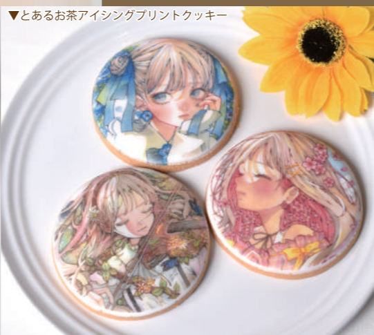
▲とあるお茶アイシングプリントクッキー