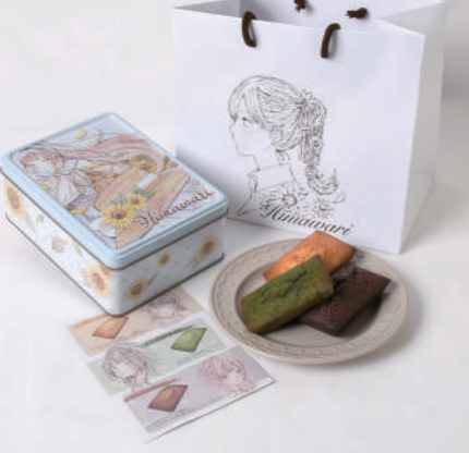
▼Himawariフィナンシェ缶(オリジナル缶)

し …やりたいことがあるとモチベーションに繋がりますよね！ さ …だんだんいい年になってきたので…やるなら早い内にやっとかない。笑 し …10年何かをするってなるとエネルギーを注げる時間もあまりないじゃないですか。最終的には好きなことしながら生きていきたいですね。