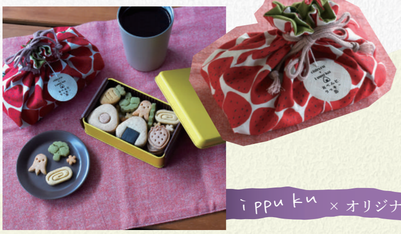
米粉と卵のおやつ工房 i ppu ku / オンライン販売・イベント出展

缶をお弁当箱に見立てたクッキー缶。缶を包むのは、缶の大きさに合わせて作成したオリジナルの巾着袋。こちらは Atelier chironu という布雑貨のお店とのコラボ。ハギレを使って作るため、どの柄が届くか一期一会。 見た目から中身まで、本物のお弁当のような作り込みがワクワクします!