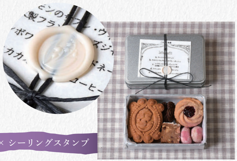
こまどり菓園 × シーリングスタンプ

プレーン缶でクッキー缶を作りたけれど「包装はどのようにされていますか?」というお問い合わせをいただきます。そこで今回はプレーン缶のアレンジ方法に着目し、スタッフが「おっ! これいいかも!」と思ったパッケージをいくつかピックアップしてみました。 お店の個性や様々な表現がしやすいプレーン缶。看板商品作りにぜひ役立ててみてください!