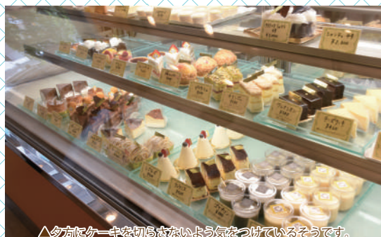
▲夕方にケーキを切らさないよう気をつけているそうです。

んなに変わらないので、満足感が出るようにしました。値段は3000円代後半で売れたかったのでも「この値段出してこれだけしか入ってない」とお客さんにガッカリされたら終わりなんです。 し …それに手を出してもらいやすくなるための、オリジナル缶です。ね。催事とかは出られるんですか？ さ …オリジナル缶もあったので横浜のSOGOのクッキー博覧会に出ました。ブースとあるお茶さんの色が強くて、設置してから「これお茶さんの店じゃね？」となりました。笑