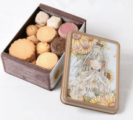
▼Himawariクッキー缶(オリジナル缶)