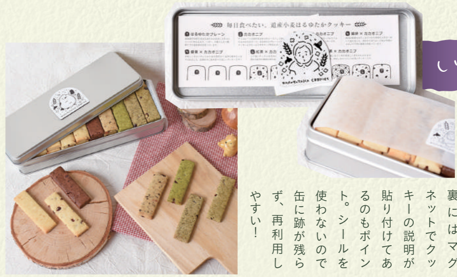
いちさか × オリジナルマグネット

お菓子のミカタの缶はスチール製なので磁石がくっ付きやすい。その性質を利用して、マグネットをパッケージに採用したクッキー缶が意外とレア! 可愛いイラストをあしらったオリジナルのマグネットが天面と蓋裏に。蓋裏にはマグネットでクッキーの説明が貼り付けてあるのもポイント。シールを使わないので缶に跡が残らず、再利用しやすい!