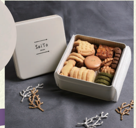
SaiTo / オンライン販売・イベント出展

まるで印刷されているかのようなロゴは、スタンプなんだそうです! スタッフも最初は騙されました...! 「プレーン缶に名入れできますか?」というお問い合わせも多いのですが、スタンプを押すことで手軽に実現。シンプルにロゴだけかっこよくまとめやすい! 季節などで色を変えやすいメリットもありますね。