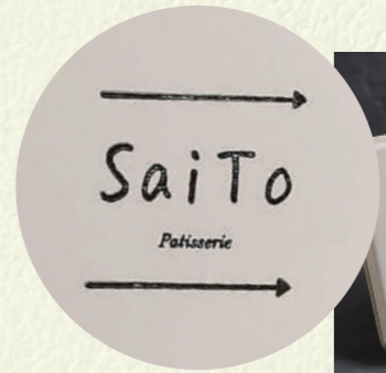
SaiTo × ロゴスタンプ

缶をお弁当箱に見立てたクッキー缶。缶を包むのは、缶の大きさに合わせて作成したオリジナルの巾着袋。こちらは Atelier chironu という布雑貨のお店とのコラボ。ハギレを使って作るため、どの柄が届くか一期一会。 見た目から中身まで、本物のお弁当のような作り込みがワクワクします!