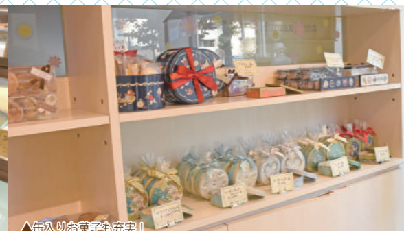
▲缶入りお菓子も充実！

パティスリーヒマワリ 〒332-0017 埼玉県川口市栄町 2-1-11 フランス川口栄町パークフロント 105 10:00~20:00 月曜定休 ・店舗営業 ・オンラインショップ